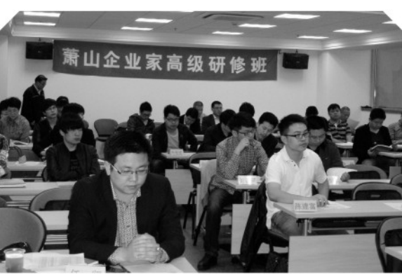
▲ 认真听课 积极思考

上海工业咨询发展有限公司董老师就“面对新经济发展布局，把握玉环县海洋经济发展机遇”这一主题作了精彩的讲演。其中，对如何把握新经济形势下玉环县的创新机遇，以及如何开拓工业经济发展新领域等问题做了前瞻性的梳理。特别当谈及台湾创业青年需要到大陆发展的话题时，更引起了学员的强烈反响。玉环作为浙江省重要的对台工作基地，在这方面确实有很好的发展前景。培训班课程还包括领导干部的人文视野与心灵养护，领导干部的领导力与执行力，以及中美关系与南海局势、领导干部实事求是的科学世界观和方法论等内容。另外，此次培训班还安排去安亭汽车城做现场教学，参观新老复旦校区等活动。（徐竹林）