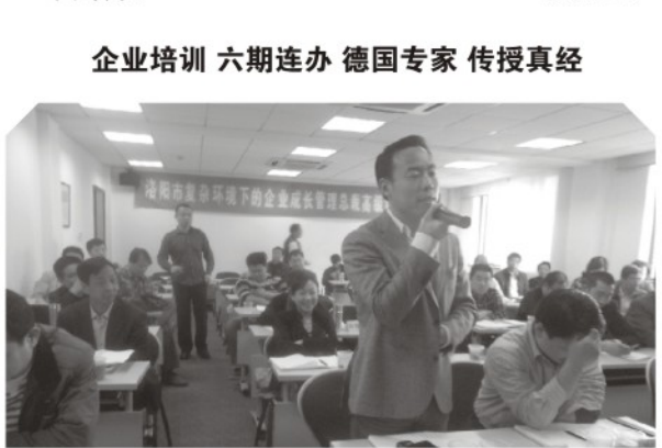
▲ 学员在培训班上踊跃发言

为了实现新疆昌吉州的跨越式发展，让昌吉州各族干部明确发展方向和担负的历史重任，2010年11月，新疆昌吉州在我院举办了为期一个月的处级干部经济管理培训班。作为培训后的延伸服务，2012年4月，应昌吉州的需求，我们安排了昌吉州州长一行与上海市人民政府发展研究中心进行了座谈交流。交流后，上海市人民政府发展研究中心应邀赴昌吉州实地考察，并为该州如何实现“三个率先”发展提供决策咨询。