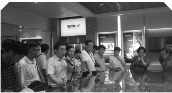
▲ 学员赴同济大学考察

时至今日我国已有88家高新区，但是存在着不同程度的“同质化”问题。继国际制造业大规模向发展中国家转移之后，国际服务业向发展中国家转移的趋势方兴未艾。如何在这样一个重要时期，抓住机会提升园区发展步伐，成为各地各园区思考和行动的方向。在这样的大背景下，云南省委组织部、云南省工信委今年联合委托我院举办了云南省