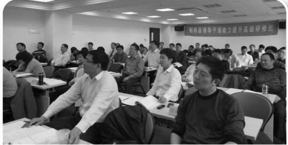
▲射阳县领导干部能力提升高级研修班课堂掠影

射阳县领导认为,培训为射阳领导干部提高科学发展的素质能力帮了大忙。扬州市委组织部认为,培训对“三个扬州”(即创新扬州、精致扬州、幸福扬州)建设是一个有力促进。(王红军)