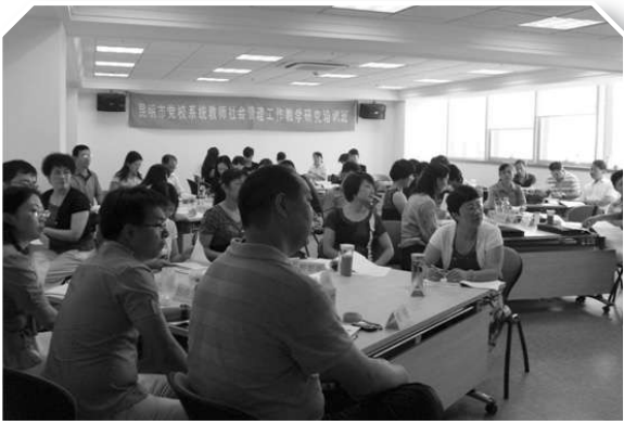
▲昆明市党校系统教师社会管理工作教学研究培训班座谈交流