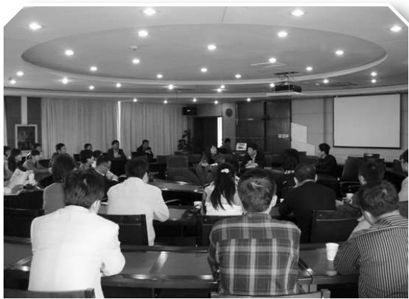
▲宁夏优秀青年干部提高社会管理能力专题研讨班与专家座谈