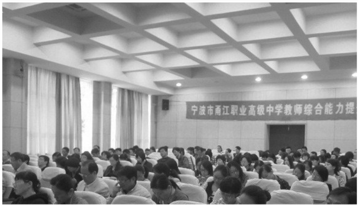
宁波市甬江职业高级中学教师综合能力提升研修班掠影

学员们认为,这次研修班学风严谨、内容新颖,理论性和可操作性都很强;通过培训,使心灵得到滋养,胸怀变得宽大,对今后做好工作帮助很大。(徐竹林)