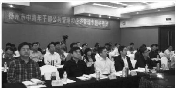
▲扬州市中青年干部公共管理 and 经济管理专题研修班课堂掠影

培训方式灵活多样。培训以集中授课和实地考察为主,理论与实践、课堂教学与互动研讨相结合。还组织全体学员到上海航运交易所、洋山港、昆山花桥国际商务区、上海市北工业园区等地现场教学,晚间开展小组讨论和集体讨论,帮助学员消化吸收所学内容。25次专题讲座,7次实地考察、现场教学,3次专家座谈交流,多次举行集体讨论和小组讨论,使学员们感到紧张充实;