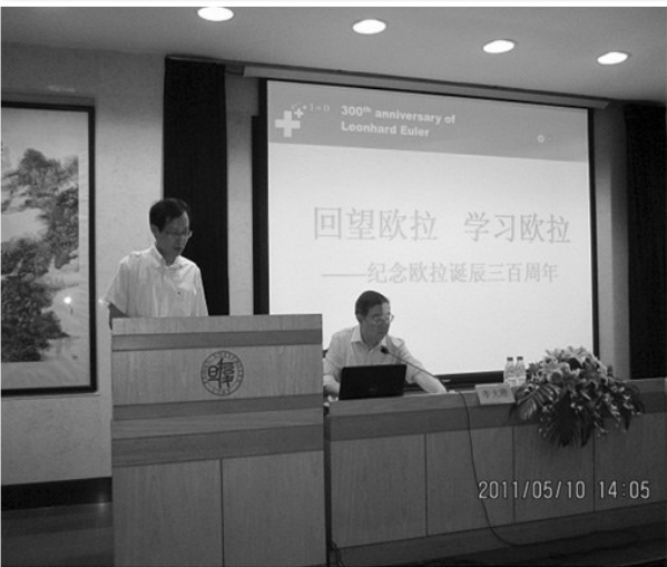
院士讲座-上海市黄浦区高中数学高级研修班