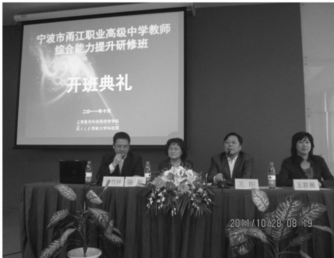
宁波市甬江职业高级中学教师综合能力提升研修班开班典礼

10月28-29日,宁波甬江职业高级中学委托我院举办了宁波甬江职业高级中学教师综合能力提升研修班,甬江职高125名教师参加了培训。